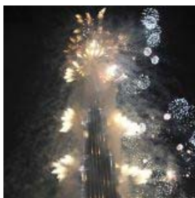
Feuerwerk rund um den neuen Gebäuderiesen in Dubai

Dubai setzt mit einem 828 Meter hohen Turm seinen Rekorden die Krone auf